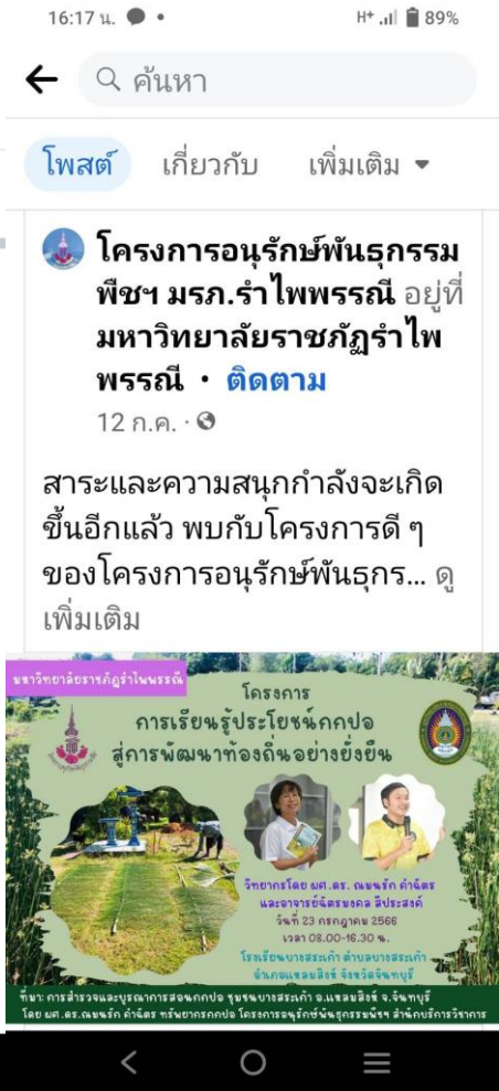
ภาพประชาสัมพันธ์โครงการ